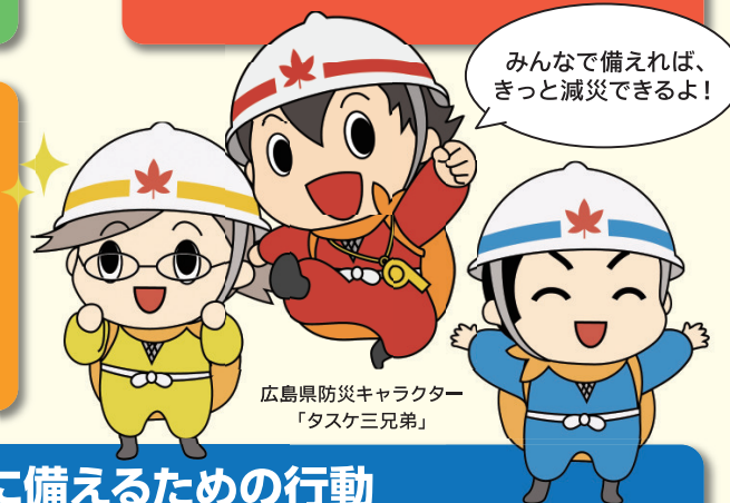
広島県防災キャラクター 「タスケ三兄弟」