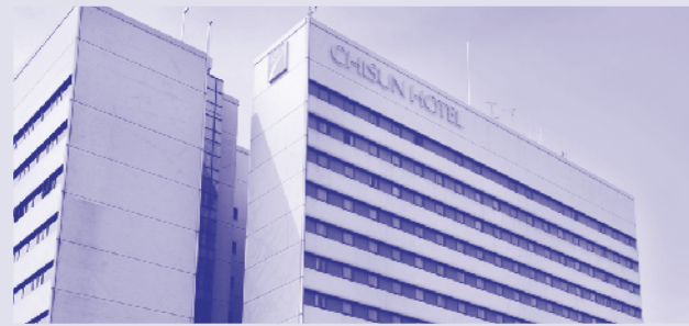
チサンホテル神戸