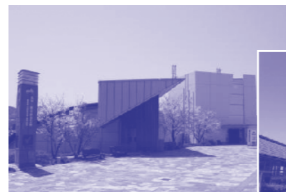
北淡震災記念公園

※昼食として軽食を用意いたします。 ※時間によって、新長田の商店街視察は取りやめることもあります。